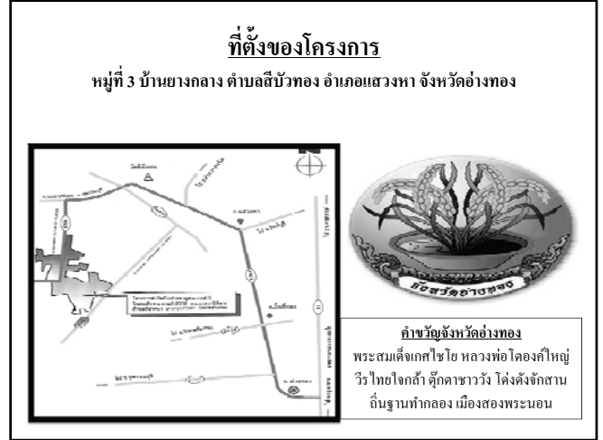
ที่ตั้งของโครงการ หมู่ที่ 3 บ้านยางกลาง ตำบลสีบัวทอง อำเภอแสวงหา จังหวัดอ่างทอง