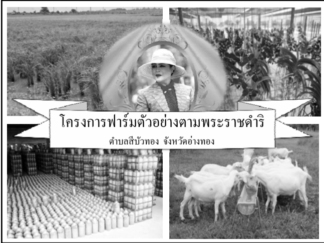
โครงการฟาร์มตัวอย่างตามพระราชดำริ ตำบลสีบัวทอง จังหวัดอ่างทอง